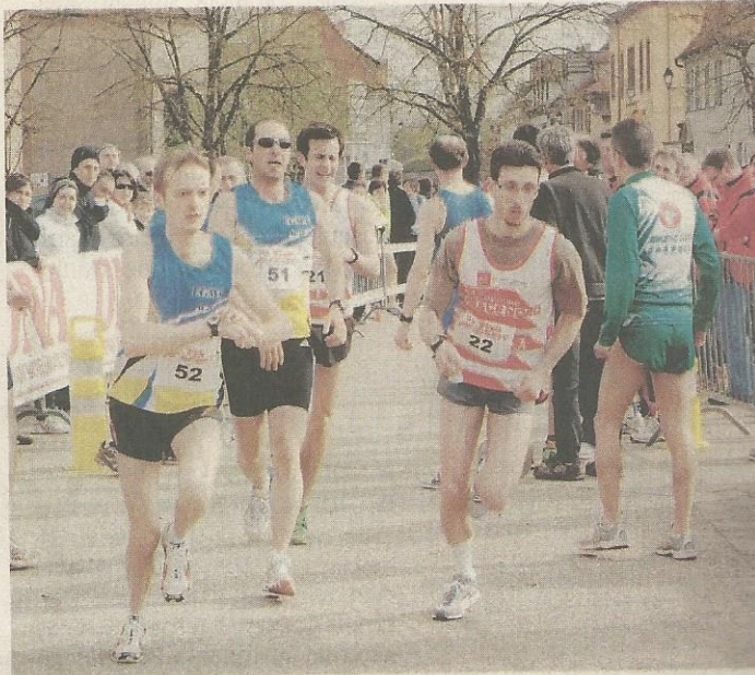
Vingt-six équipes ont été classées, hier à Neuf-Brisach.

Un écart que Jérôme Ropers, l'ancien du PCA, aujourd'hui au CMC, s'empresait d'aller combler (34'21